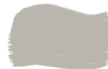
Salt cod. T2