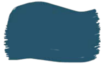
Navy cod. T3