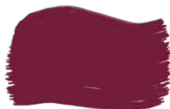
Borgogna cod. T3