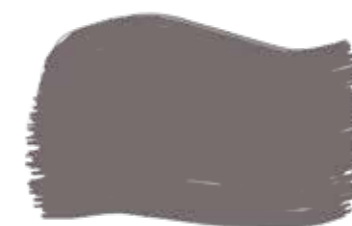
Saddle cod. T2