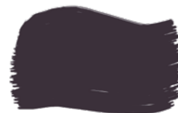
Graphite cod. T3