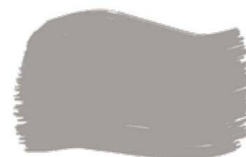
Dust cod. T2