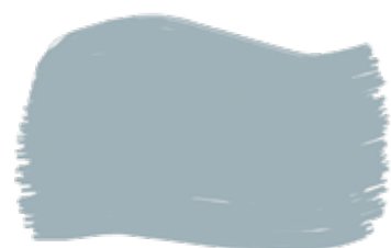
Carta da zucchero cod. T2