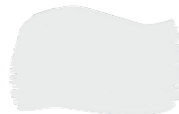
Pure cod. T1