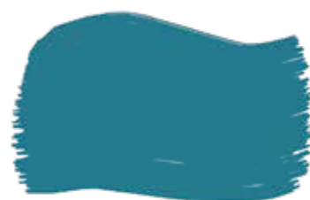
Petrolio cod. T2