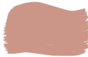
Blush cod. T2