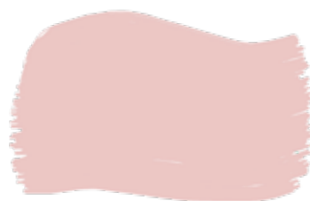
Bubblegum cod. T2