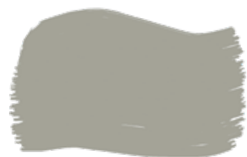
Salvia cod. T2