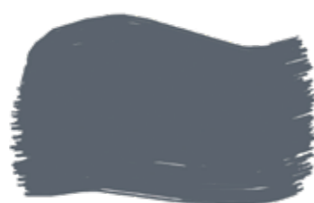
Avio cod. T2