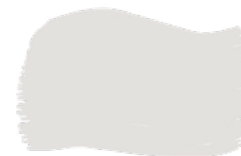
Ecrù cod. T2