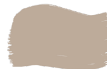
Juta cod. T2