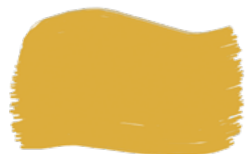
Senape cod. T2