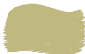
Avocado cod. T2