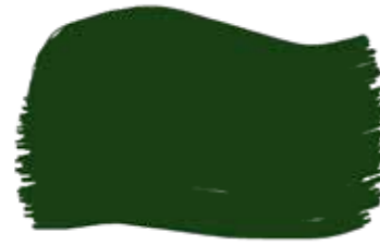
Forest cod. T3